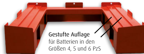
Gestufte Auflage für Batterien in den Größen 4, 5 und 6 PzS