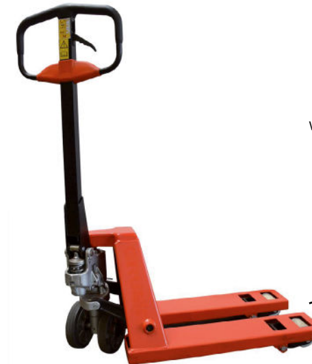
Große Norm-Lastrollen (ø 82 mm)