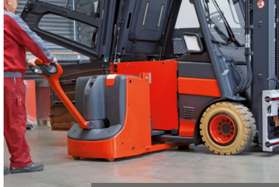
Entladen der Batterie mit Hubwagen für einen schnellen Batteriewechsel.

Somit entfallen Leerlaufzeiten und die Stapler sind sofort wieder einsatzbereit. Der Einfahrschlitten des Hubwagens neigt sich beim Ein- oder Ausfahren der Batterie automatisch in die richtige Position.