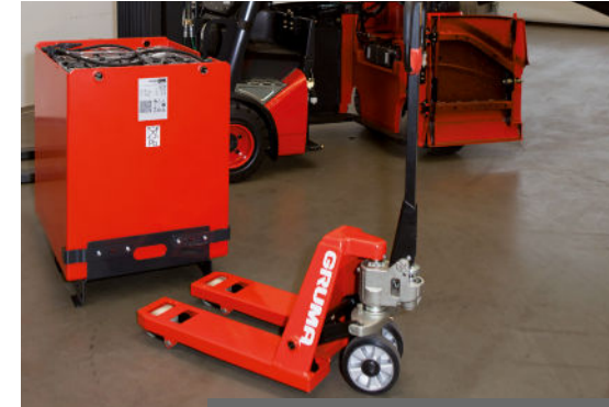
Mit dem Hubwagen lässt sich die Batterie leicht aus dem Stapler ziehen.

Hier schaffen Batteriewechselsysteme, wie der BASICBATT Abhilfe. In wenigen Minuten kann die Batterie von nur einer Person ganz unkompliziert getauscht werden. Der Hand-Hubwagen BASICBATT ist extrem wendig und kräftesparend durch seine großen Lastrollen.